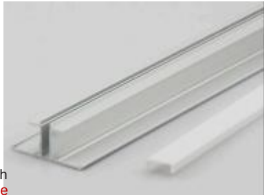
2 m length 2 m Länge